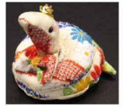
大きさ：直径 7cm × 高さ 7cm 程度

日付：12/15 (日) 時間：10:00 の部 13:30 の部 制作目安：2 時間 参加費：1,200 円 定員：各 15 名 対象：小学生以上 (小学生 1 名につき保護者 1 名同伴)