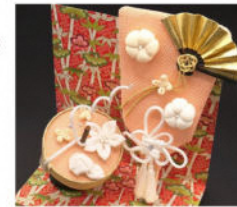
羽子板の大きさ：縦 15cm × 横 8cm 程度

日付：12/1 (日) 時間：9:30 ~ 13:00 制作目安：3 時間半 参加費：2,500 円 定員：15 名 対象：中学生以上 ※昼休憩はありません