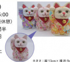
大きさ: 縦13cm x 横約9cm

制作目安: 4時間半 参加費: 3,500円 定員: 15名 対象: 中学生以上