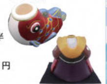
大きさ: 鯉1体 縦5cm x 横7.5cm程度 兜 縦7.3cm x 横8cm

伝統工芸品『白雲土』を使用した陶器の兜と鯉に自由に絵付けをします! 白雲土とは『白雲石』を主成分とする素材で、焼き上がりが非常に白くぬめらかで、彩色が映え美しく絵付けできます。(鯉はお二人で制作可能です。)