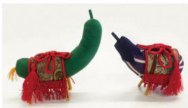
大きさ：茄子 縦6.5cm×横10cm程度 胡瓜 縦6cm×横9cm程度

正絹ちりめんで盆飾りの茄子と胡瓜をつくります。胡瓜の馬と茄子の牛の飾りは先祖や故人への「道しるべ」と「おもてなし」を形にしたものです！手作りの可愛い飾り物でお盆をお迎えしましょう！