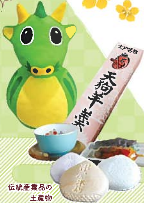
伝統産業品の 土産物