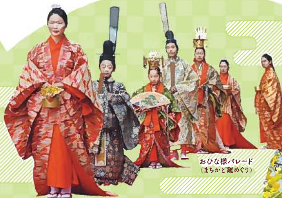
おひな様パレード (まちかど雛めぐり)